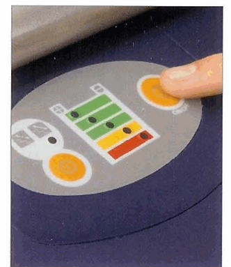
Die Steuerung des escalino ist übersichtlich angeordnet.