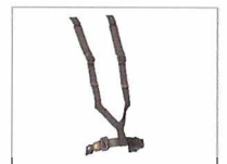
Hosenträgergurt inkl. Beckengurt