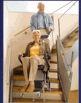
Der escalino bietet auch auf gewendelten Treppen hohe Sicherheit und Komfort.

Die innovative Steighilfe überwindet Treppen praktisch im Alleingang. Die Steigbeine bieten dabei sicheren Stand und verhindern Beschädigungen an Treppenkanten. Im Hand leicht ausgefahren heben sie den Sitz an und ermöglichen einfaches Ein- oder Aussteigen. Dank der großen Räder und Steigbeine ist der escalino auch auf Gitterrosttreppen einsetzbar.